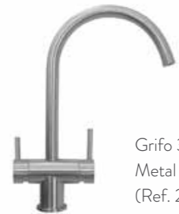
Grifo 3 vías Metal Free Inox (Ref. 298008)