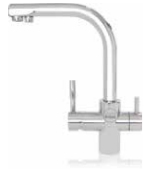
Grifo 3 vías Metal Free (Ref. 298003)